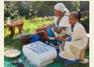
コーヒーセレモニー 名産のコーヒーでおもてなしをする伝統的なコーヒーセレモニーを体験します。