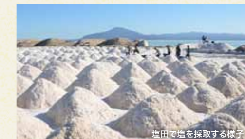
塩田で塩を採取する様子