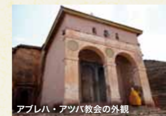
アブレハ・アツバ教会の外観

メケレ近郊には4世紀～5世紀頃に造られた岩窟教会が多数残っています。エチオピアで岩窟教会と言えばラリベラが有名ですが、メケレ近郊でも小さいながらも美しい壁画の残る教会をご覧ください。