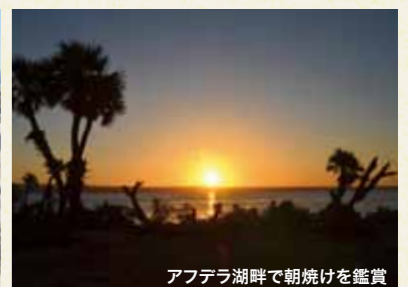
アフデラ湖畔で朝焼けを鑑賞