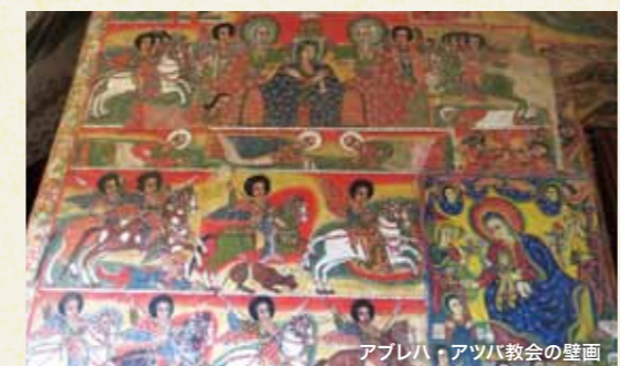
アブレハ・アツバ教会の壁画