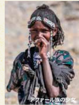
アフアール族の少女

古くからダナキル砂漠で塩の交易を支配してきたアフアール族は、イスラム教を信仰し、遊牧生活を送る人々です。ツアー中はアフアール族の村を訪れ、彼らの暮らしや文化にふれます。