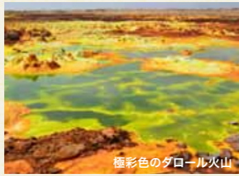
極彩色のダロール火山

キャンプ泊を含む辺境の旅で最も大切なことは日程にゆとりを持つこと。日没前に余裕をもってキャンプに到着するのはもちろん、突然のトラブルにも柔軟に対応できるような日程としています。また、ツアーのハイライトとなるアハメッド・エラでのダロール地区と塩のキャラバンの見学、そしてエルタ・アレ火山では十分な観光時間を設け、人数も最大12名様に限定したゆとりある旅です。