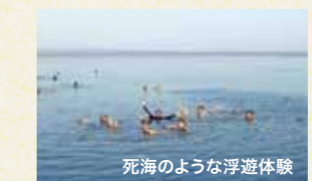
死海のような浮遊体験