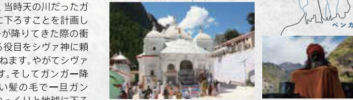
左/女神ガンガーの伝説が残る聖地ガンゴトリ 右/道中出会ったサドゥー

ばかりでした。標高6543m。その鋭角に聳えるシブリンの美しい山容は、インドのマッターホルンと呼ばれています。シブリン峰の真下に広がる草原地帯のタポバンは、アマルガンガーという名の小川が流れ、まるで別天地。周囲にはメルーやバギラティ、カルチャクンドなどのガルワール・ヒマラヤの名峰が連なり、まさに「仙境」と呼ぶにふさわしい場所です。 自分の足でしか辿り着くことのできない、シブリンBC。ここでの滞在時間は、本当に特別なひとときです。ぜひご自身の目で見て、体感してみてください。