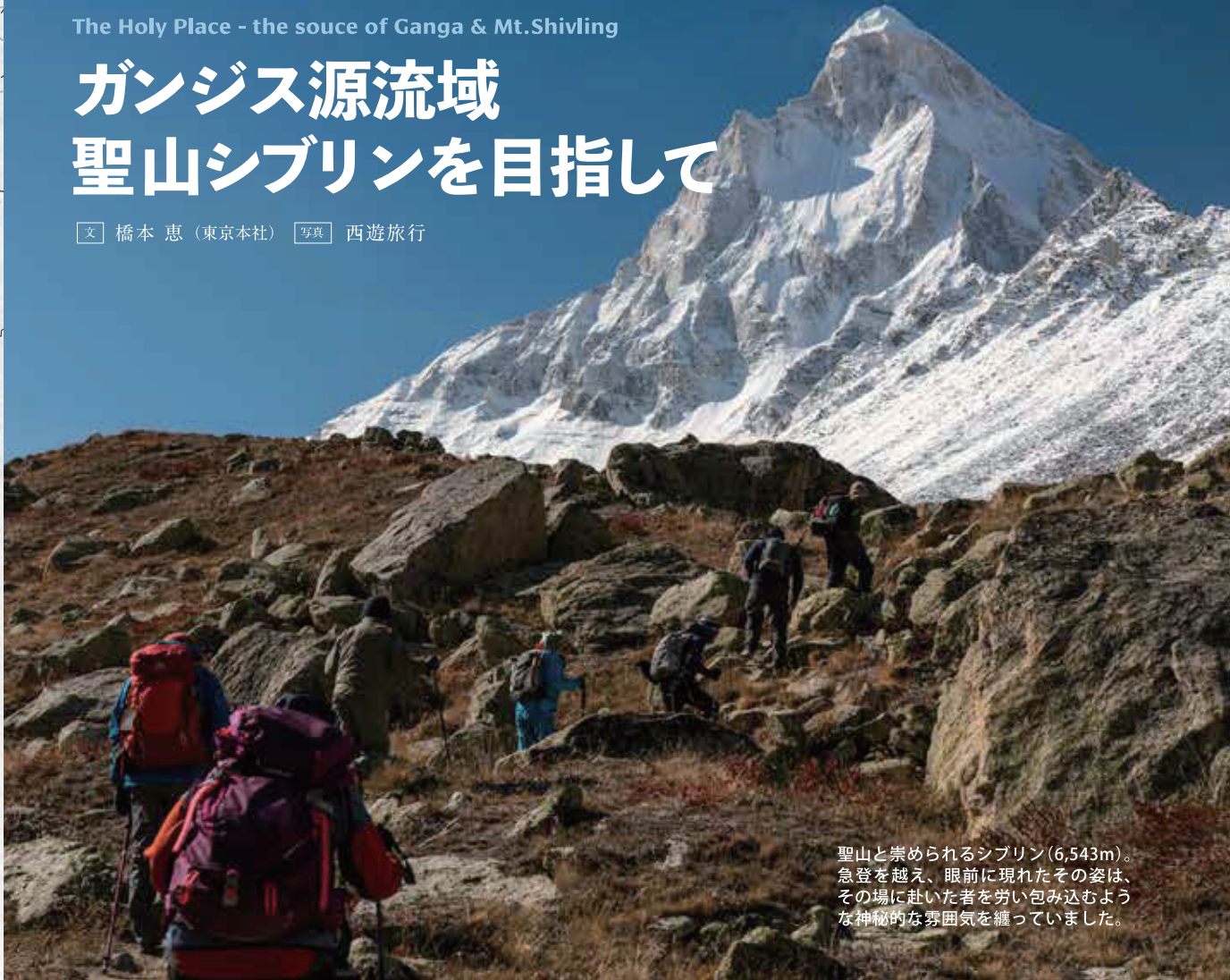
聖山と崇められるシブリン(6,543m)。急登を越え、眼前に現れたその姿は、その場に赴いた者を労い包み込むような神秘的な雰囲気を纏っていました。